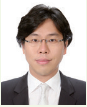
박상수 변호사 대한변호사협회 부협회장

자녀가 학교폭력에 노출되었을 때 부모님들은 어떤 대응을 할 수 있을지 몰라 당황하는 경우가 많습니다. 특히 최근에는 코로나-19의 영향으로 사이버 학교폭력 발생건수가 증가하고 있습니다. 사이버 학교폭력을 포함한 학교폭력 발생 시 학생은 물론 가정과 학교 모두에 심각한 영향을 미치게 됩니다. 그리고 당연히 가해자에 대한 엄벌이 요구되기도 합니다. 그러나 2차 세계대전 이후 형사법계에서는 형벌의 목적을 단순한 응보적 처벌이 아닌 교화를 목적으로 하는 견해가 주류를 이루고 있습니다. 교육의 목적이 더욱 큰 학교에서 발생하는 학교폭력의 문제에서는 더욱 교화적 목적이 실현될 필요가 있습니다.